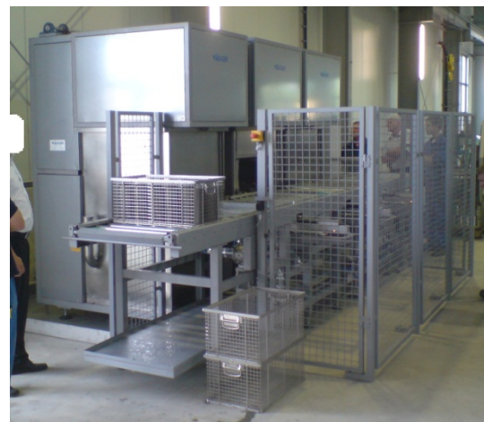
mehrere ROTOREn 67 als Vollautomat verkettet