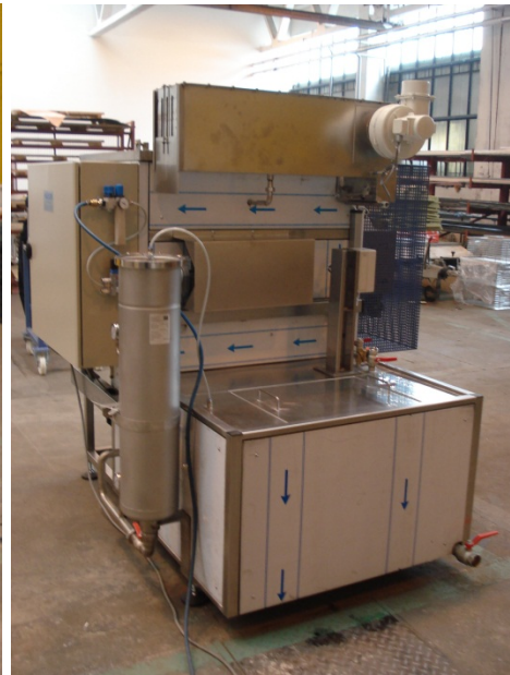
ROTOR 60 mit Beutelfilter, Schwadenkondensator, Heiß-/Umlufttrocknung uvm.