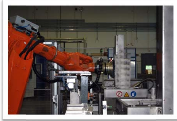
Be- und Entladen mittels Roboter