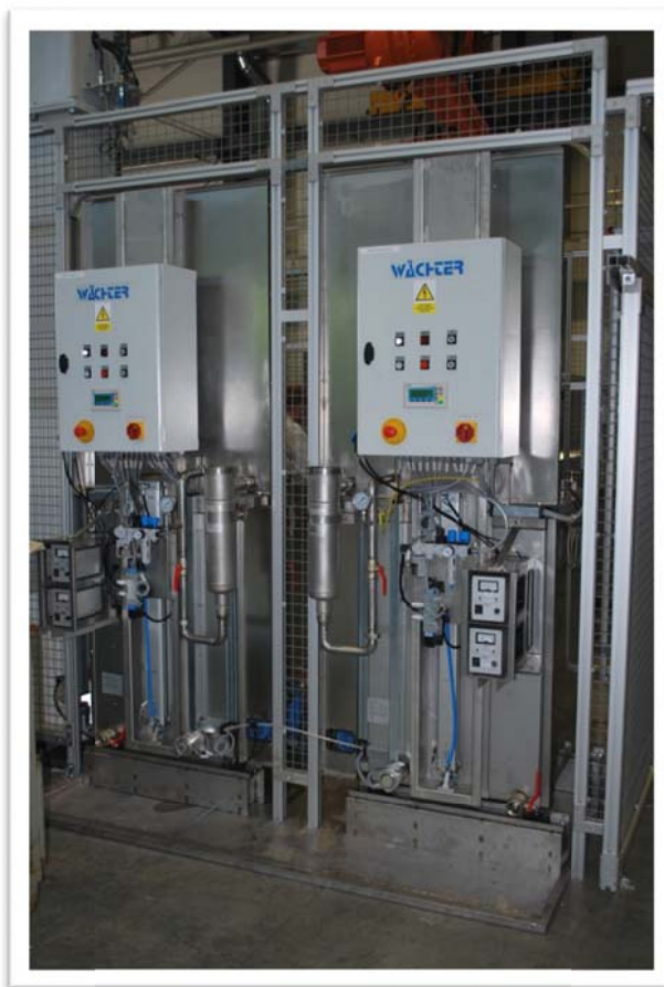
Abbildung zeigt rückwärtige Ansicht; alle Elemente leicht zugänglich außerhalb des Schutzzaunes.