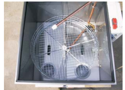
Abdeckblech mit Doppelfilter