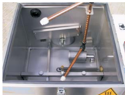
Öl-/Scheibenskimmer, Ansaugfilter, V2A-Heizung, Spritzrohre